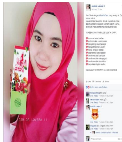
Caption : ANTARA PRODUK YANG DIPAMERKAN.