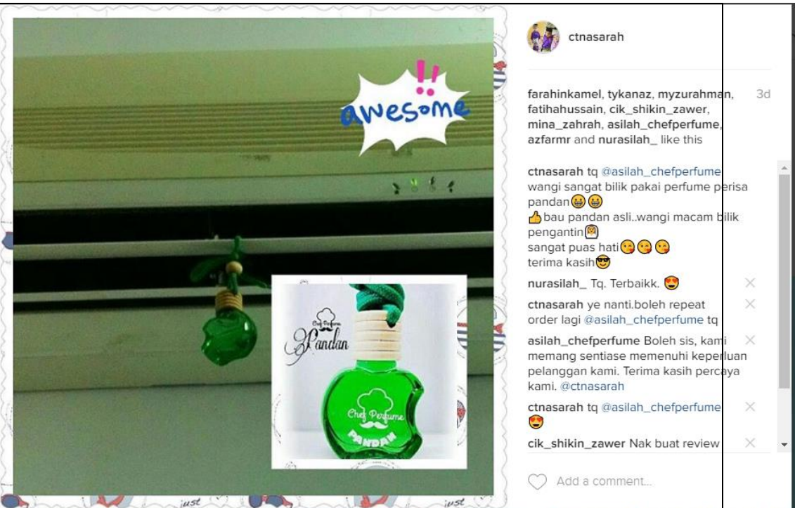
Caption : ANTARA TESTIMONI DARIPADA PELANGGAN BELIAU SETELAH MENGGUNAKAN PRODUK TERSEBUT.

iv) Lain-lain (contoh : proses penghasilan produk, penglibatan dalam aktiviti lain, dsb)