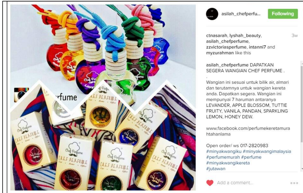
Caption : PRODUK YANG DIJUAL OLEH BELIAU