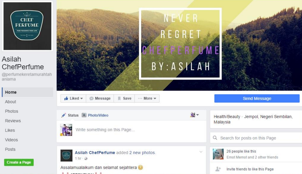
Caption : BELIAU MEMBUAT PROMOSI PRODUK JUALAN MENGGUNAKAN MEDIA SOSIAL INSTAGRAM & FB PAGE.

iv) Lain-lain (contoh : proses penghasilan produk, penglibatan dalam aktiviti lain, dsb)